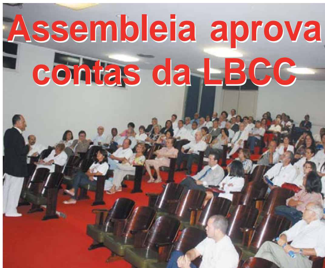
Assembleia contou com a presença de associados, conselheiros, diretores, servidores e voluntários

Sociedades médicas: R$ 17.988,901, representando